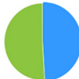
Export vers le réseau Autoconsommation

Graphiques : deux points de vue pour un même profil prosumer .