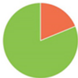
Consommation depuis le réseau Autoconsommation